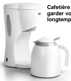
Cafetière isotherme pour garder votre café chaud longtemps.