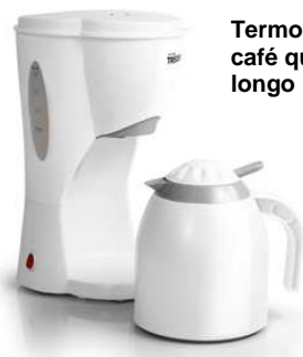
Termo para manter o seu café quente durante um longo período de tempo.