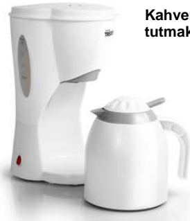
Kahvenizi uzun süre sıcak tutmak için termos.