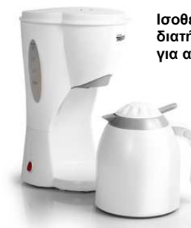
Ισοθερμικό δοχείο για τη διατήρηση του καφέ ζεστού για αρκετό χρόνο.