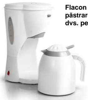
Flacon cu vacuum pentru păstrarea căldurii cafelei dvs. pentru mai mult timp.