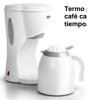
Termo para mantener el café caliente durante un tiempo.