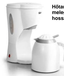
Hőtartó edény a kávé melegen tartásához hosszabb időn át.