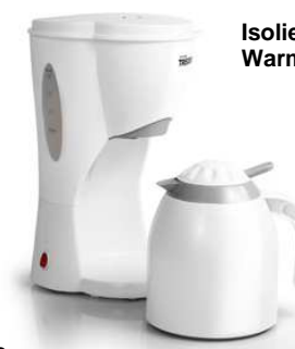
Isolierkanne zum längeren Warmhalten Ihres Kaffees.