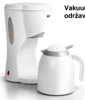
Vakuumska posuda dugo održava vašu kavu toplom.