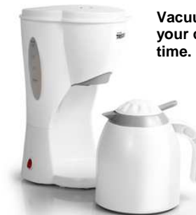
Vacuum flask for keeping your coffee warm a long time.