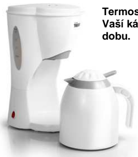
Termoska pro uchování Vaší kávy horké po dlouhou dobu.