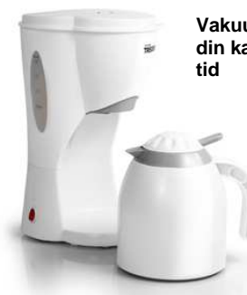
Vakuumflaske som holder din kaffe varm over lengre tid