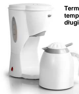
Termos utrzymujący temperaturę kawy przez długi czas.