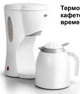
Термос за запазване на кафето горещо дълго време.