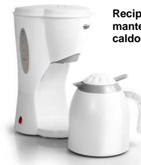
Recipiente isoteramico per mantenere il vostro caffè caldo per lungo tempo.