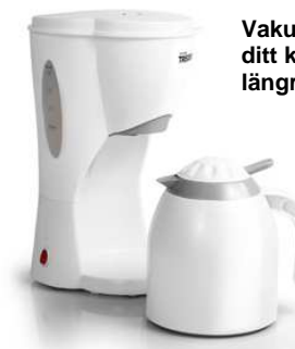
Vakuumflaska för att hålla ditt kaffe varmt under en längre tid.