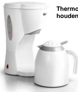
Thermoskan voor het lang warm houden van uw koffie